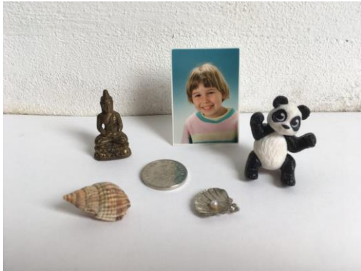
Voorbeeld van kleine dierbare objecten.