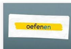
Eerst de Ik-vorm Trainer