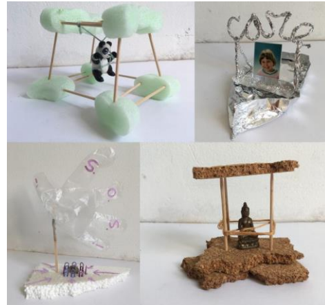
Voorbeeld van de drijvende musea.