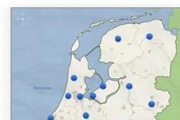
Topo Nederland Trainer