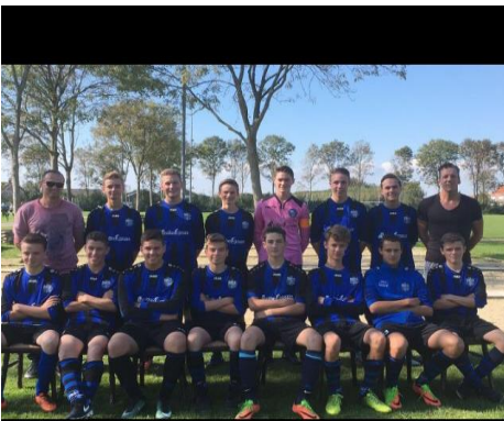
Mijn team SKNWK JO19-1